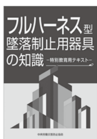
フルハーネス型安全帯使用作業 特別教育用テキスト