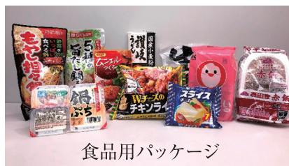
食品用パッケージ