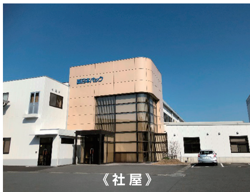
《 社 屋 》

認証取得：ISO9001認証取得 (No.4244)、ISO14001認証取得 (No.E2221)、FSSC22000認証取得 (No.R056)