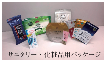
サニタリー・化粧品用パッケージ