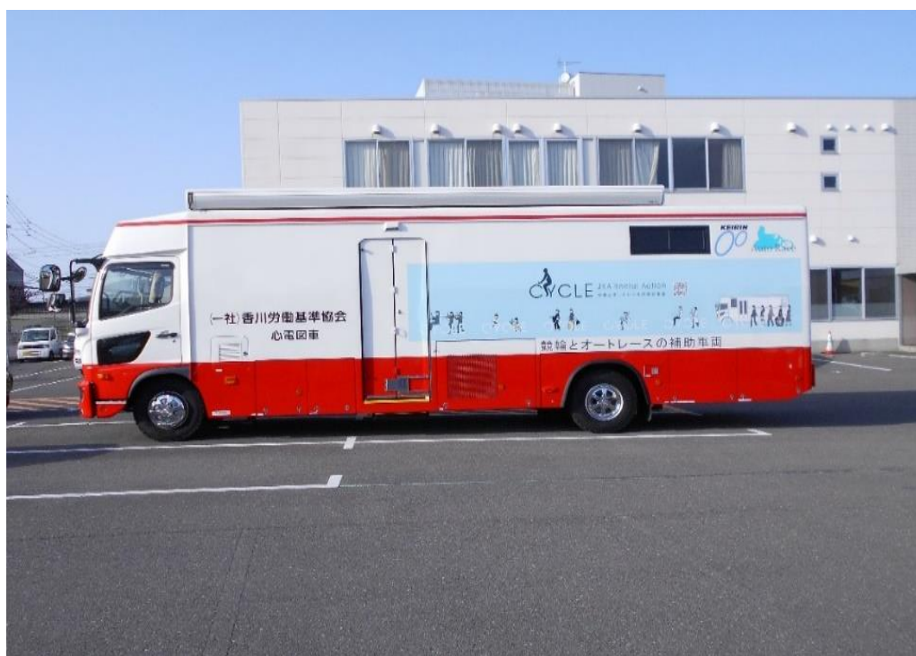
循環器(心電図・身長・体重・胸囲)検診車